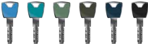
hellblau türkisblau resedagrün umbragrau saphirblau schwarz