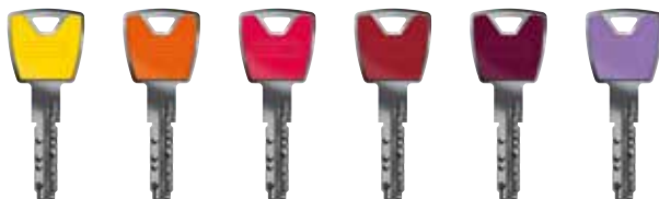
zinkgelb orange erdbeerrot rubinrot violett lila

Bei XP20S können Sie zwischen zwölf unterschiedlichen Farben für den Schlüsselkopf auswählen. So gehört die Schlüsselsuche der Vergangenheit an. Jeder weiß sofort, welcher Schlüssel ihm gehört.