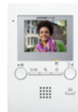
Poste de locataire GT-1M3