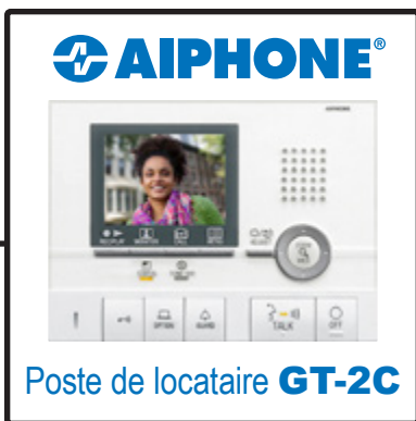
Poste de locataire GT-2C

Pour le mode d'emploi complet (3,7 Mo), scannez le code QR ou utilisez le lien pour le télécharger à partir du site Web du fabricant : www.aiphone.com/gt-2c_op-man