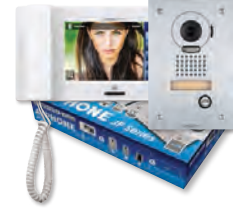
JPS-4AEF JP-4MED, JP-DVF, PS-2420UL

Poste principal secondaire : Sélectionnez jusqu'à 7 postes (optionnel)