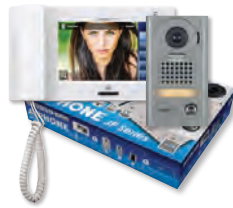
JPS-4AEV JP-4MED, JP-DV, PS-2420UL