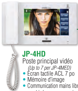
JP-4HD Poste principal vidéo (Up to 7 per JP-4MED) • Écran tactile ACL 7 po • Mémoire d'image • Communication mains libres avec combiné pour communication privée • Câble individuel Cat-5e/6

Poste principal secondaire : Sélectionnez jusqu'à 7 postes (optionnel)