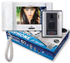
JPS-4AED JP-4MED, JP-DA, PS-2420UL

Commencez ici! Sélectionnez un ensemble en boîte