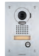
JP-DVF Poste de porte vidéo • Caméra PTZ • Acier inoxydable • À encastrer • Boîtier d'installation fourni